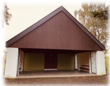
Friedhofsgebäude aktueller Zustand Juni 2024 vor der Sanierung